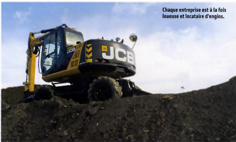
Chaque entreprise est à la fois loueuse et locataire d'engins.

Distribution | Financement | Location | Réparation | Assurances | Formation